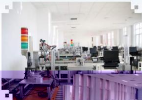
自动化生产线安装与 调试训练场所