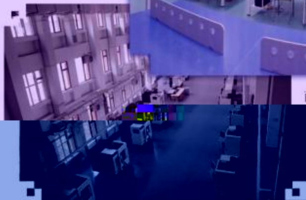
DMG 数控技术 训练场所