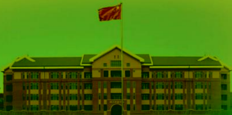
天津机电职业技术学院

TIANJIN VOCATIONAL COLLEGE OF MECHANICAL AND ELECTRICAL ENGINEERING