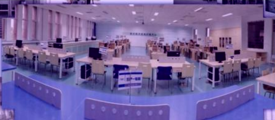
商贸管理类专业 综合训练场所