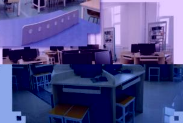
一体化课程教学设计 综合实训室